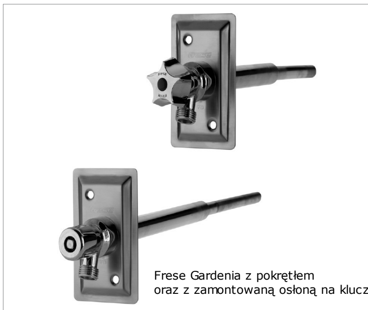
Frese Gardenia z pokrętłem oraz z zamontowaną osłoną na klucz